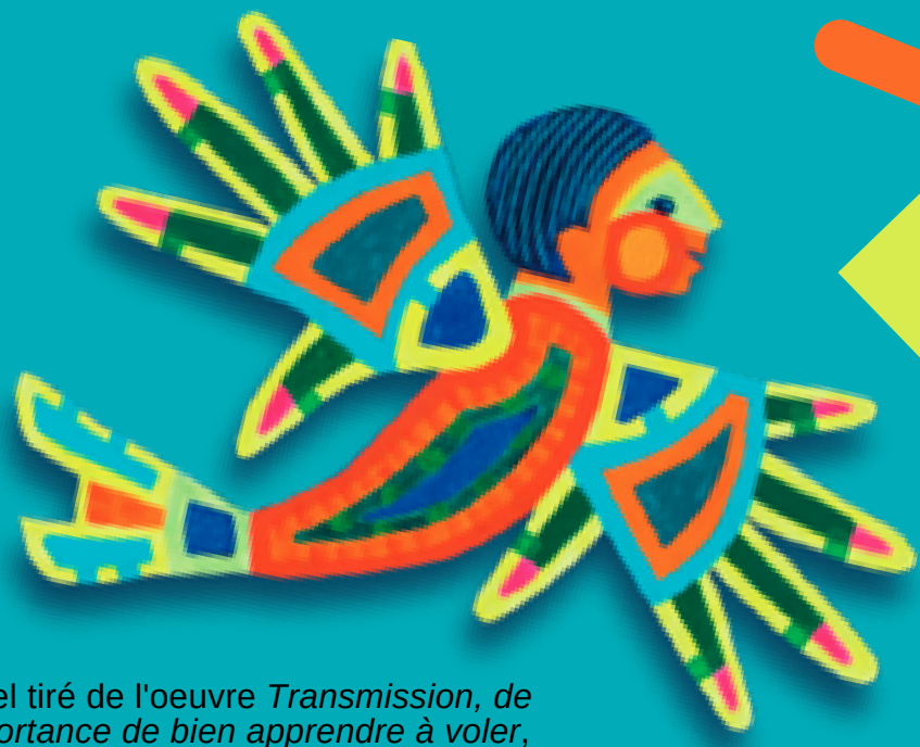
Visuel tiré de l'œuvre Transmission, de l'importance de bien apprendre à voler , Christine Sioui Wawanoloath

Vous vous demandez si les livres dans votre classe ou dans votre bibliothèque traitent de manière appropriée les perspectives/réalités/savoirs autochtones?